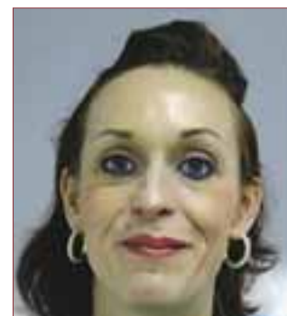
Les agents recenseurs recrutés par la Mairie.