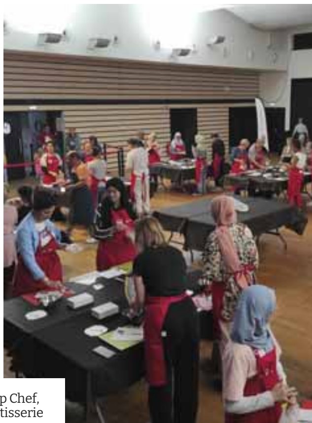
25 mai - Le chef Norbert Tarayre, rendu célèbre grâce à l'émission Top Chef, était de passage à Dugny avec l'agence Happy Cook pour un atelier pâtisserie en compagnie des dugnysiens dans la salle Henri Salvador.