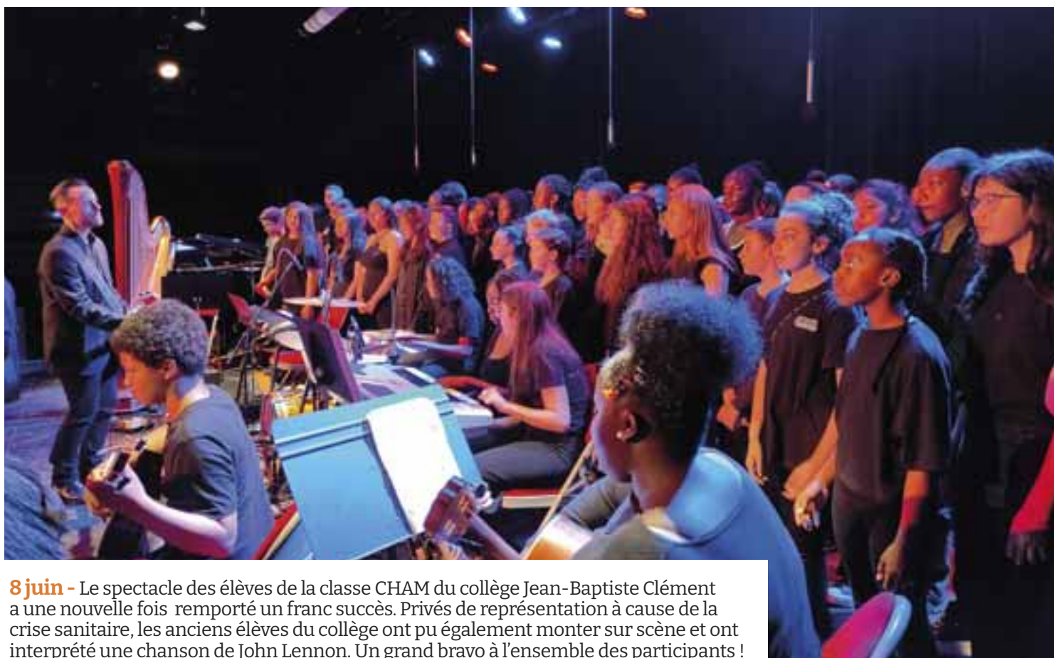
8 juin - Le spectacle des élèves de la classe CHAM du collège Jean-Baptiste Clément a une nouvelle fois remporté un franc succès. Privés de représentation à cause de la crise sanitaire, les anciens élèves du collège ont pu également monter sur scène et ont interprété une chanson de John Lennon. Un grand bravo à l'ensemble des participants !