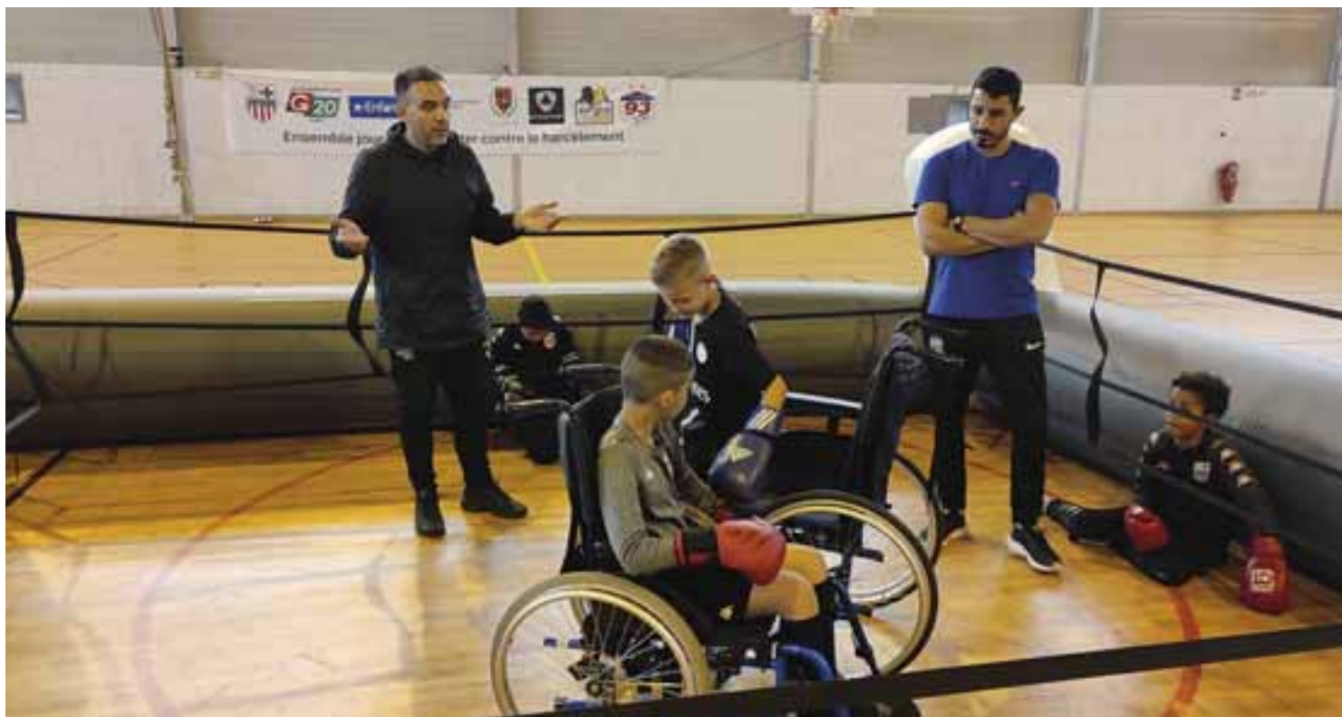
25 mai - La journée handisport, qui s'est déroulée au gymnase Alain Mimoun, a permis aux enfants de s'essayer à la pratique du sport (ici la boxe) en situation de handicap. Merci aux associations de la ville qui ont participé à la mise en place de cette action.