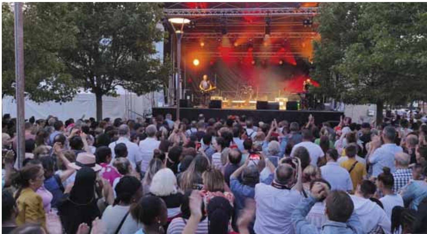
21 juin - La Fête de la Musique a battu son plein sur le parvis Edith Piaf, grâce notamment à un public nombreux et à la représentation du célèbre groupe Emile et Images !